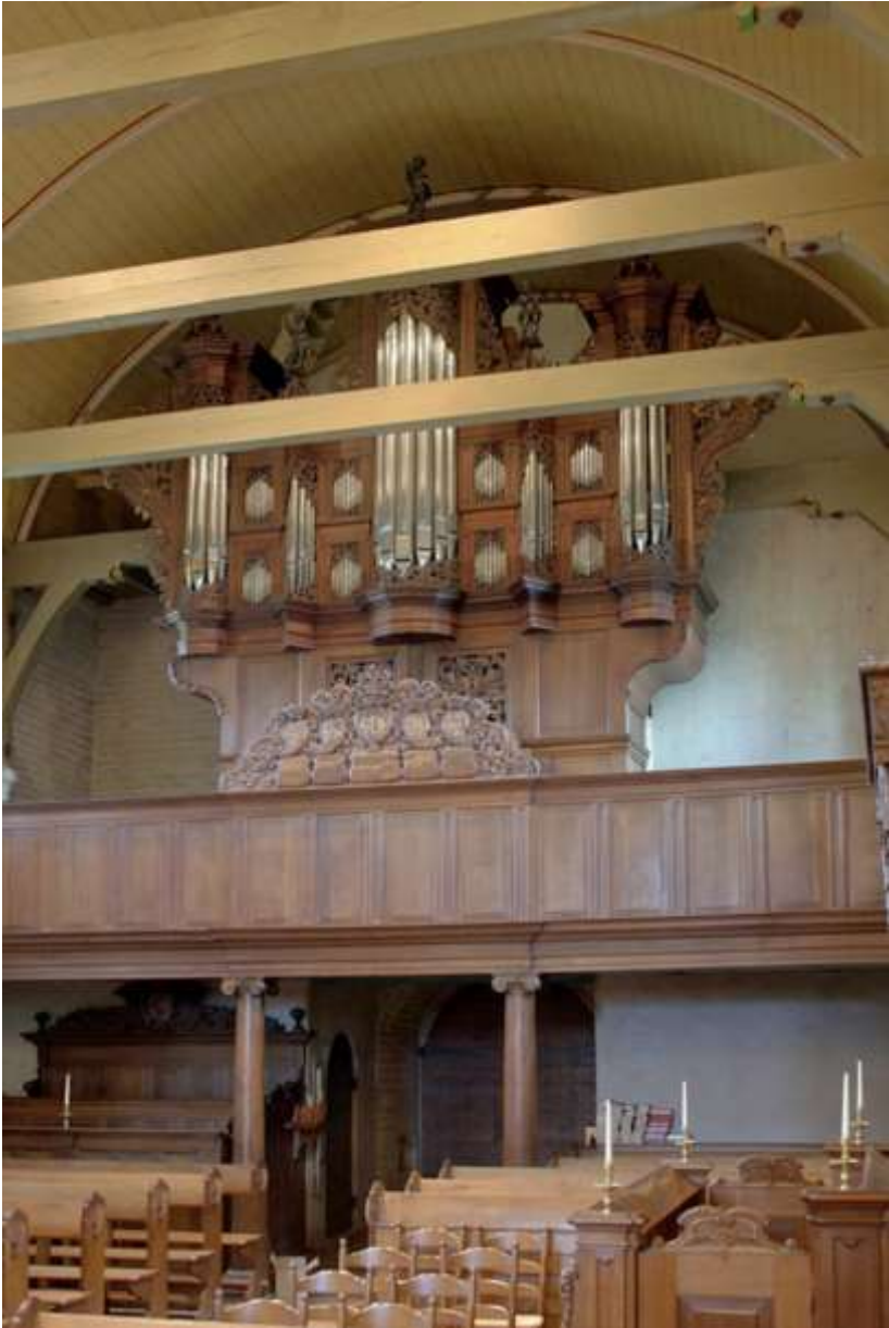
Het Radeker-/Garrels-orgel Magnuskerk Anloo