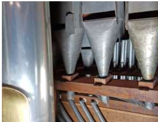
Bordon met schuifjes