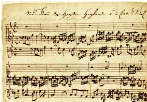
'Nun komm der Heyden Heyland' (BWV 660a)

Ze heeft concerten gegeven in Spanje, onder andere met het Jeugd Orkest van Madrid (Jorcam). In januari 2015 won ze het 2 e Cabanilles Orgelconcours voor jonge organisten in Agemesí (Valencia). Verder gaf ze concerten in onder meer de Martinikerk te Groningen, het Orgelpark in Amsterdam en de Grote Kerk te Leeuwarden.