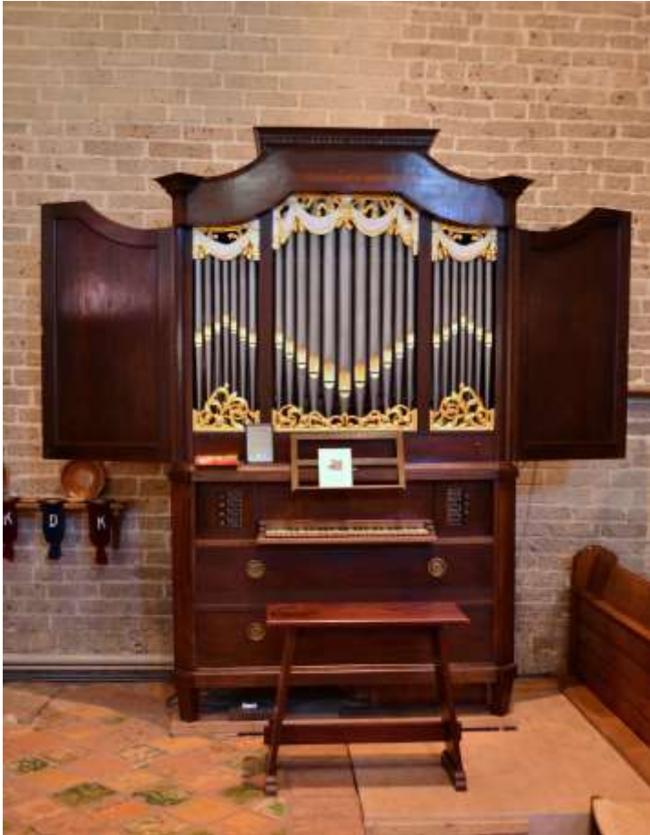
Freytag-orgel Magnuskerk Anloo