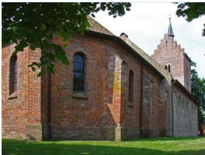
Magnuskerk - Anloo