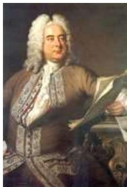
Georg Friedrich Händel