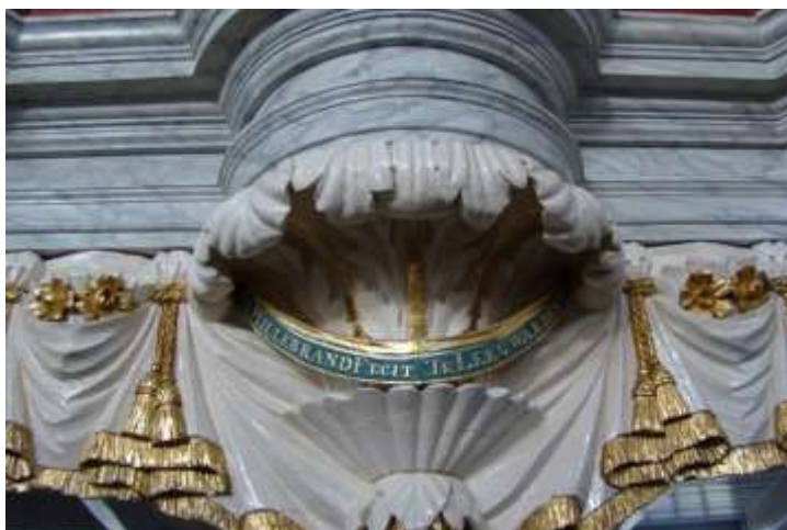
'Hillebrand Fecit Te Leeuwarden': in de Koepelkerk - Veenhuizen