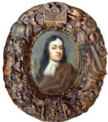
Johann Adam Reincken