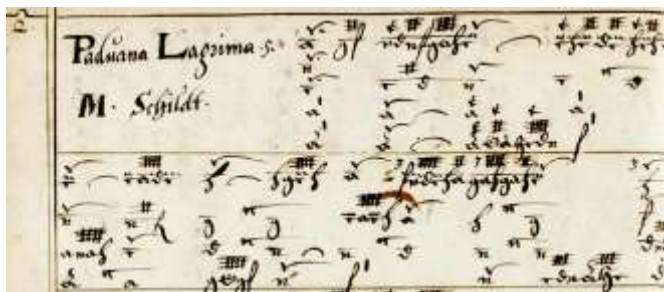
Fragment tabulatuur - Melchior Schildt