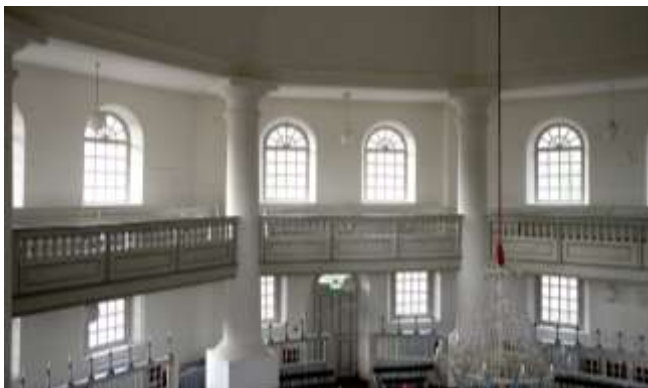
Interieur Koepelkerk - Veenhuizen

http://klavecijnist.wixsite.com/robert-koolstra