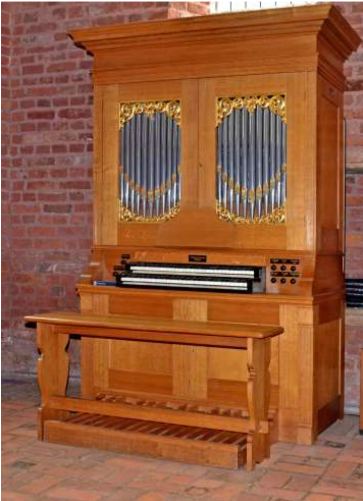
Van Vulpen-organ Magnuskerk - Anloo