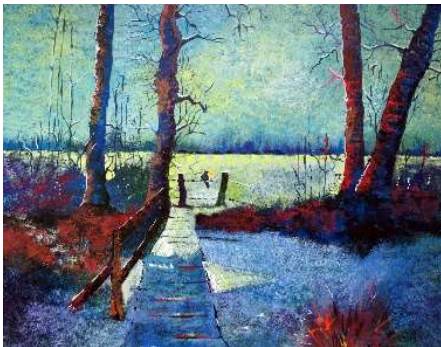
Winters landschap naar een schilderij van Henk van Donk , beeldend kunstenaar – Roderwolde www.henkvandonk.nl